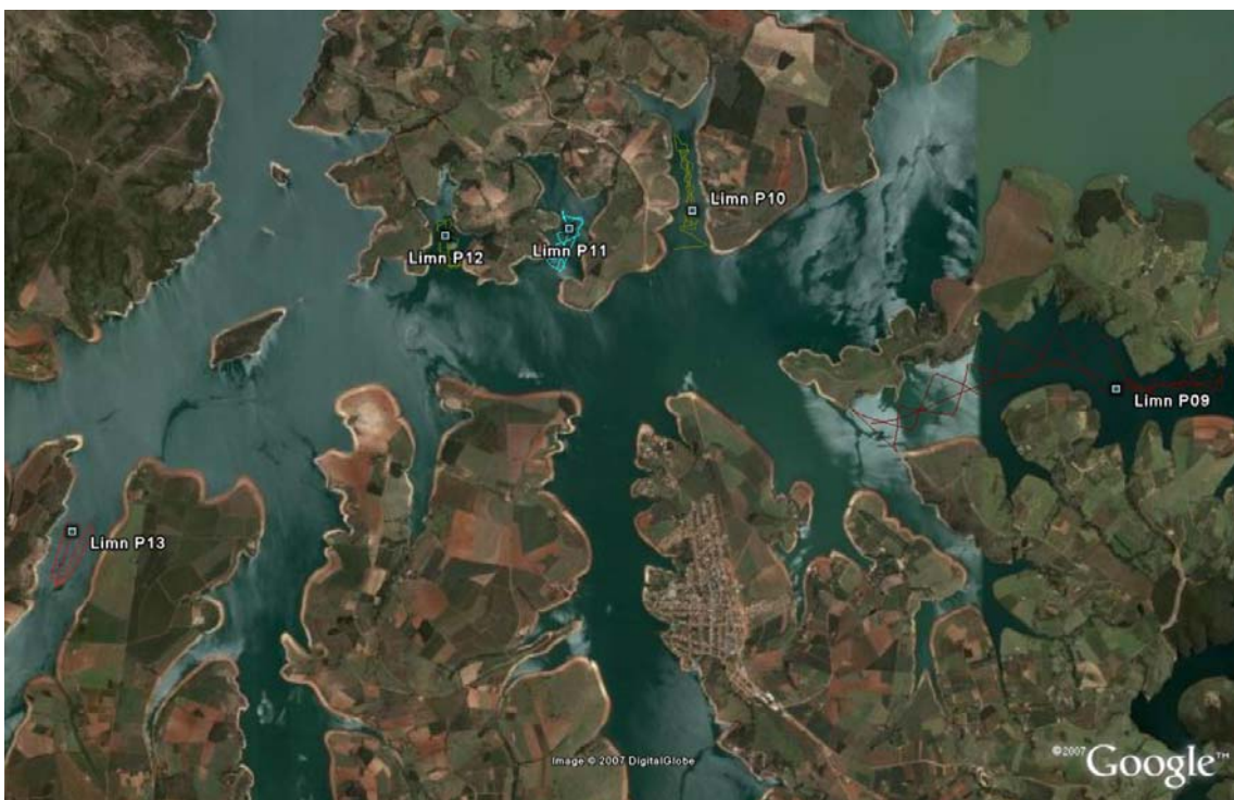
Figura 03 - (Topo) Localização dos pontos de coletas anexos os polígonos P 14-15, P 16, P 17 e P 18. – (Abaixo) Localização dos pontos de coletas junto aos polígonos P 09, P 10, P 11, P 12 e P 13 no reservatório de Furnas.