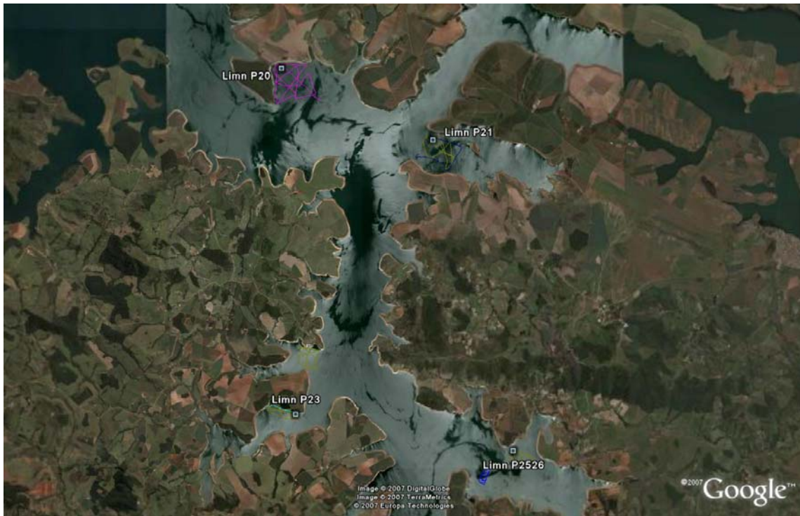
Figura 02 – (Topo) Localização dos pontos de coletas junto aos polígonos P 19, P 22, P 27 e P 28 no reservatório de Furnas. (Abaixo) – Localização dos pontos P 20, P 21, P 23, P 25-26 no reservatório de Furnas.