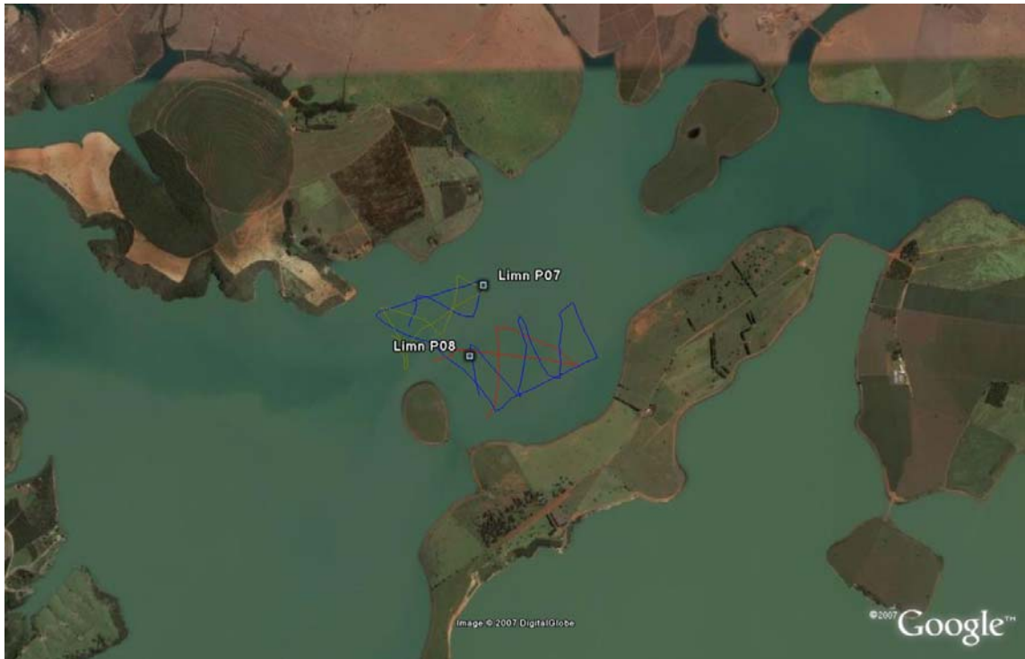
Figura 04 - Localização dos pontos de coletas anexos os polígonos P 07 e P 08 no reservatório de Furnas.